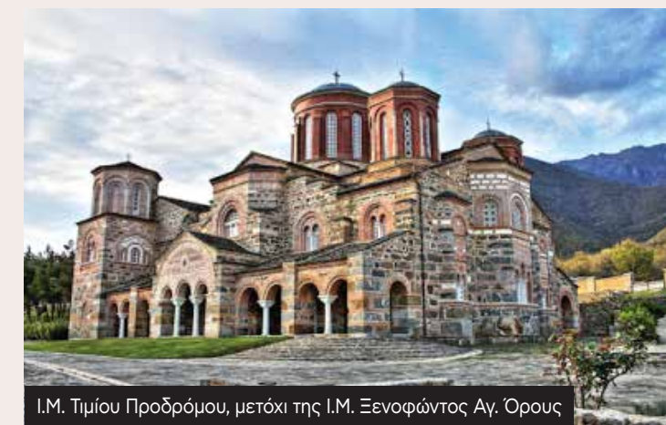
I.M. Τιμίου Προδρόμου, μετόχι της I.M. Ξενοφάντος Αγ. Όρους