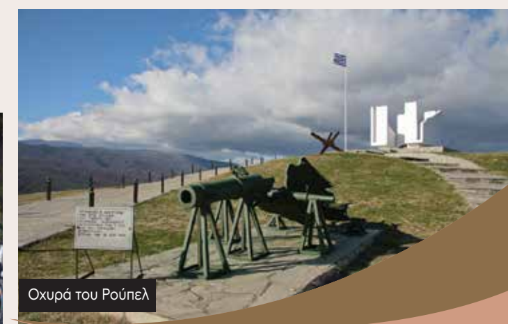
Οχυρά του Ρούπελ

Δραστηριότητες που μπορούμε να οργανώσουμε για εσάς: